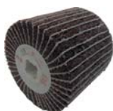
Rulli abrasivi a pag. 972-973